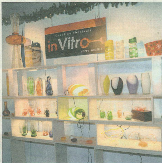
La 36e édition du Salon des métiers d'art du Saguenay-Lac-Saint-Jean débute ce mercredi.

Pour l'édition en cours jusqu'au 13 novembre au Centre de Congrès Le Montagnais, à Chicoutimi, le comité organisateur a tenu à se