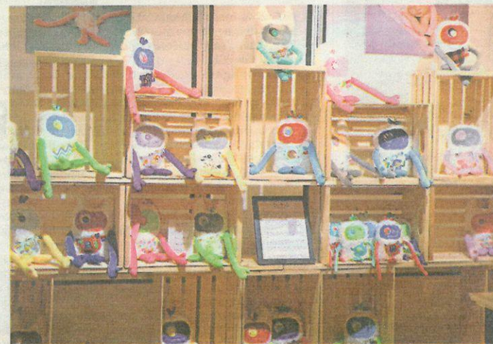
Annie Raymond d'Alma est de retour pour une seconde édition avec ses monstres à câlins. Depuis 2014, des milliers de toutous fabriqués à la main ont été remplis de bisous partout au pays.