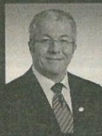
LUC BLACKBURN Président d'honneur Conseiller municipal, district n°16 Maire suppléant Ville de Saguenay